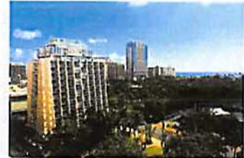
【周辺情報(ホテル内施設情報)】 ・バンケットルーム 種別：ファンクショナルルーム